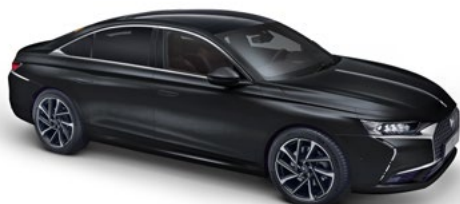
Čierna PERLA NERA (P)