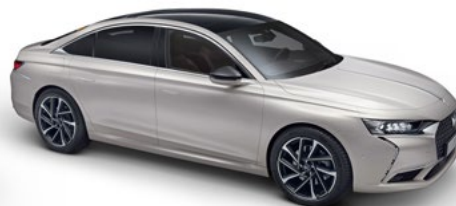
Sivá CRISTAL PEARL (P)