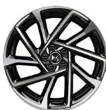
Zliatinové disky 19" VERSAILLES (v sérii pre Rivoli+)