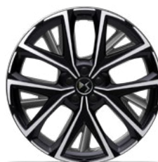
Zliatinové disky 20" MUNICH (v sérii pre Rivoli+ E-TENSE 4x4 360k)